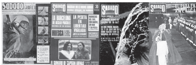
Algunas portadas históricas del semanario.